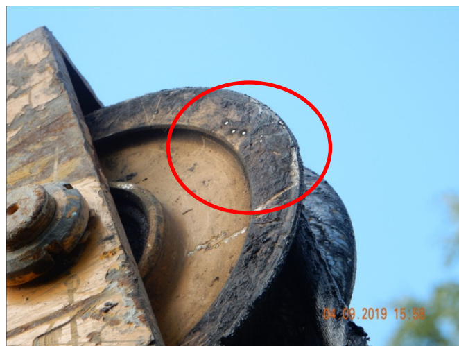
Место замыкания ВЛ-10 кВ л. 282-08 на металлоконструкцию БКМ

Прибывшая по вызову очевидцев бригада скорой медицинской помощи констатирована смерть электромонтажника.