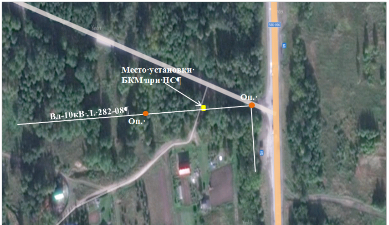
Пролёт опор № 105-106 ВЛ-10 кВ филиала ПАО «МРСК Северо-Запада» «Псковэнерго»